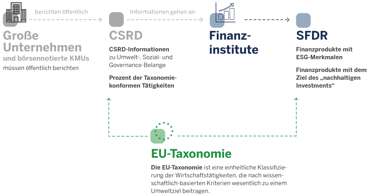
Abbildung 1: Die Verbindung von CSRD, SFDR und EU-Taxonomie