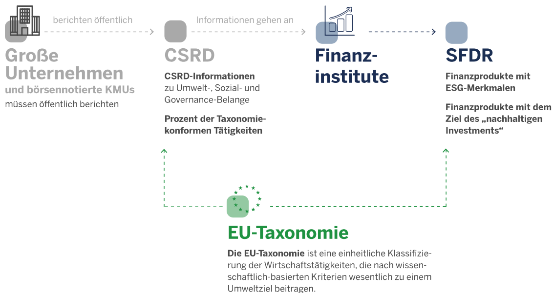
Abbildung 1: Die Verbindung von CSRD, SFDR und EU-Taxonomie